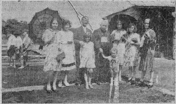
Los aspectos del acto por el cual se declaró oficialmente iniciados los trabajos de construcción de la ESCUELA JUAN RAFAEL MORA

En el terreno donde se construye el edificio para la escuela JUAN RAFAEL MORA se celebró ayer, a las nueve horas, una sencilla y a la vez significativa fiesta por la cual se declaró oficialmente iniciados los trabajos de construcción.